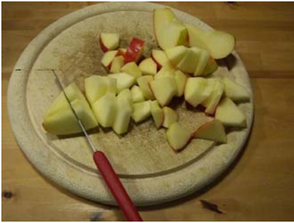
Apfel klein schneiden