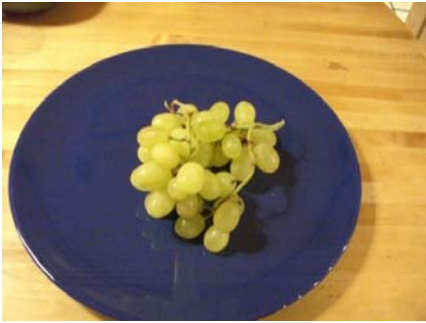
100 Gramm kernlose Trauben