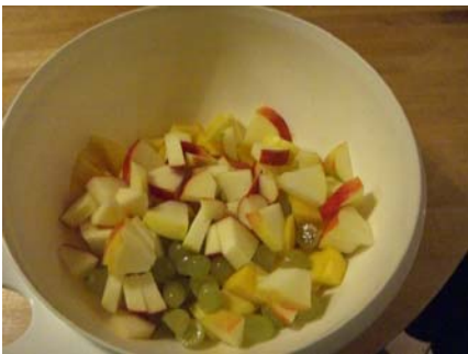
Apfelstücke in die Schüssel geben