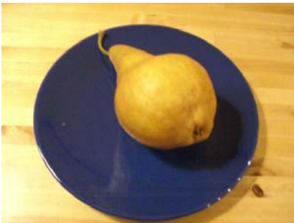
1 kleine Birne