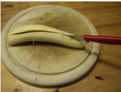
Banane der Länge nach durchschneiden