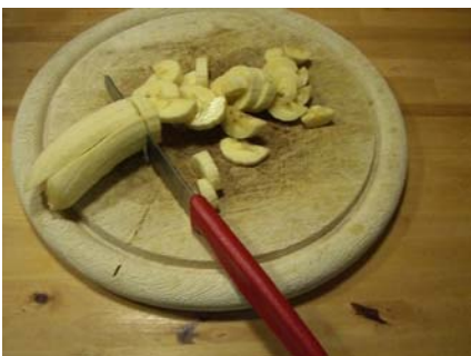
Banane klein schneiden