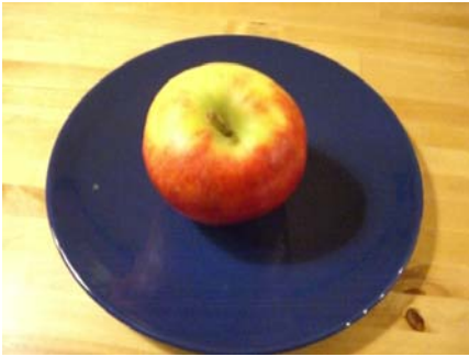
1 kleiner Apfel