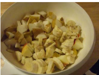
Bananenstücke in die Schüssel geben