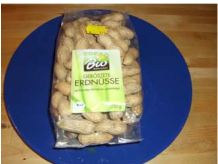
100 Gramm Erdnüsse