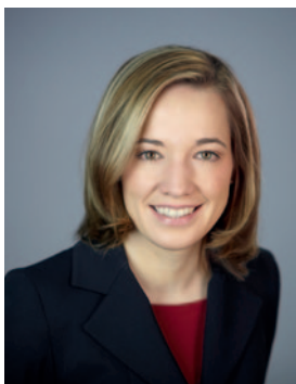
Dr. Kristina Schröder Bundesministerin für Familie, Senioren, Frauen und Jugend

„Alle sollen es wissen! Wir helfen Frauen, wenn sie beschimpft, bedroht oder geschlagen werden. Wir lassen sie nicht allein!“