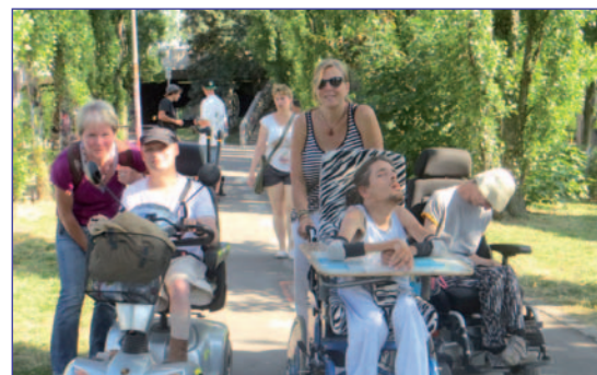
So wollen wir wohnen: selbstbestimmt und mittendrin!

Das ausführliche Programm erhalten Sie bei der LV-Geschäftsstelle und unter www.lv-koerperbehinderte-bw.de