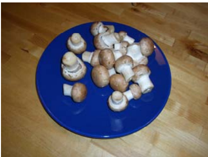
100 Gramm Champignons