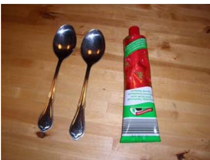
2 Esslöffel Tomatenmark